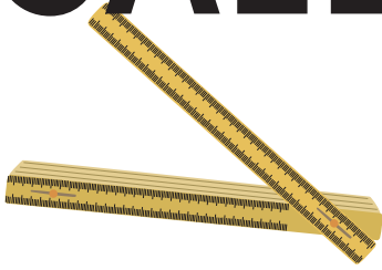
Table Ronde der SAKA-ASAC Samstag, 8. November 2025 Universität Basel